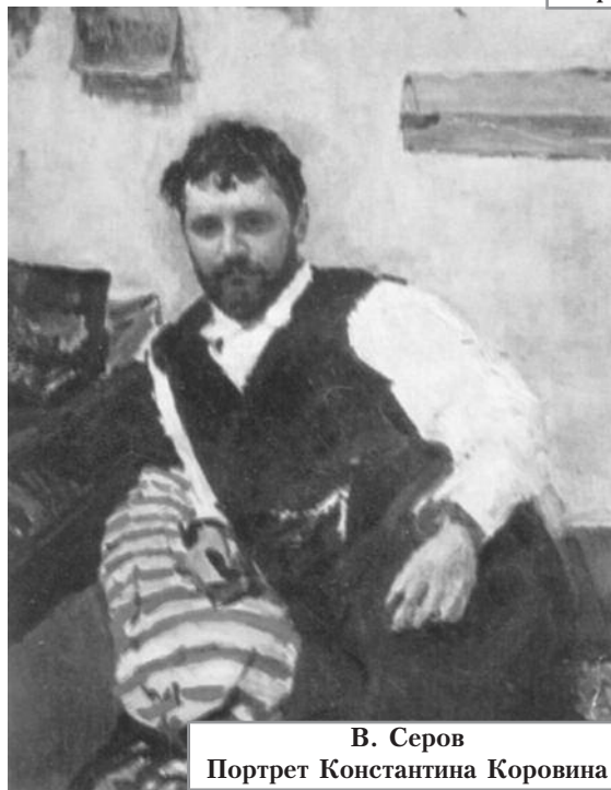
В. Серов Портрет Константина Коровина

Его знакомство с Ф. И. Шаляпиным переросло затем в крепкую многолетнюю дружбу. Он создавал декорации для спектаклей Большого, Мариинского и других театров; оформил более 100 оперных и балетных постановок, среди которых - "Руслан и Людмила", "Хованщина", "Снегурочка" и мно-